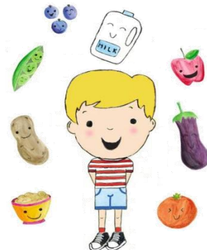
alimentação saudável começa desde cedo

Orientações sobre ementas e refeitórios escolares – DGE - 2018